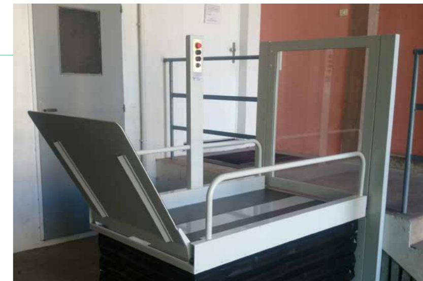
Puerta en la parada superior con cerradura eléctrica (opcional).