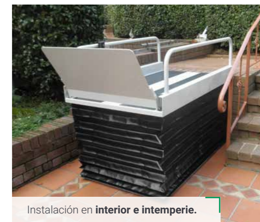
Instalación en interior e intemperie.