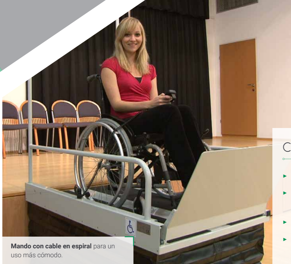
Mando con cable en espiral para un uso más cómodo.

Plazo de entrega inmediato para el modelo estándar