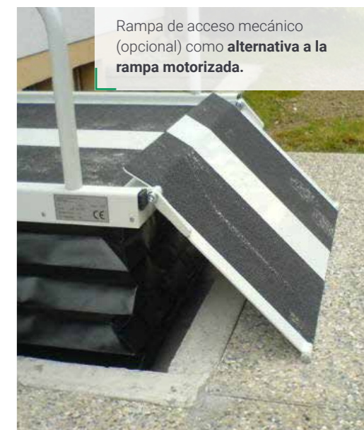
Rampa de acceso mecánico (opcional) como alternativa a la rampa motorizada.