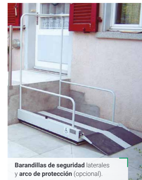
Barandillas de seguridad laterales y arco de protección (opcional).