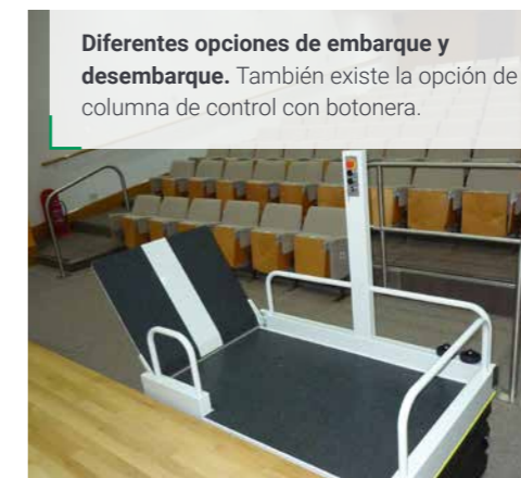
Diferentes opciones de embarque y desembarque. También existe la opción de columna de control con botonera.